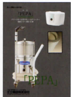
クリーンルーム用バキュームクリーナー「PEPA」