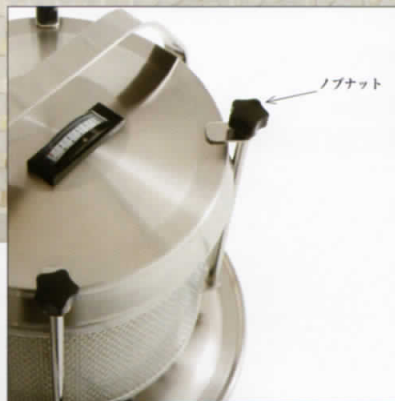
HEPAフィルターの交換は4つのノブナットで行います。(工具は不要です)