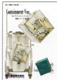
クリーンルーム用バキュームクリーナー「コンテインメントパック」