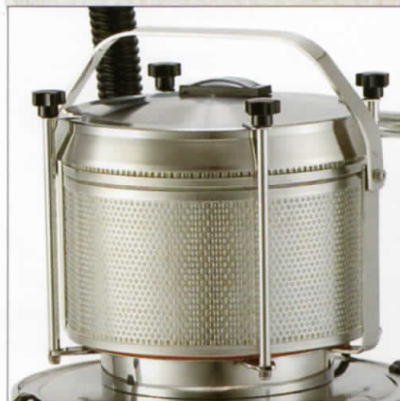
HEPA フィルターリット